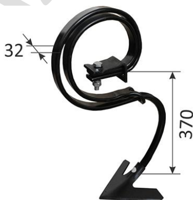
Лапа 140-200 мм

Основные рабочие органы – стойка с пропашной лапой шириной 135 или 200 мм и усилительная пружина. Дополнительно стойка может комплектоваться долотообразным наконечником для глубокого рыхления почвы.