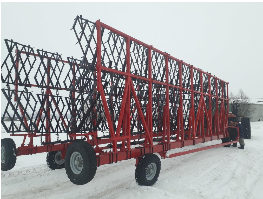
АГС-24-2з, СПК «Труд», Талицкий район. Так же хозяйство приобрело АГС-18-2з.

Общество с ограниченной ответственностью «Стратегия 96» 620042, Свердловская область, г. Екатеринбург, ул. Бакинских комиссаров, дом 107, эт. / оф. 1/4 ИНН 6686075417 КПП668601001 р/с 40702810516540026954 УРАЛЬСКИЙ БАНК ПАО СБЕРБАНК г. Екатеринбург к/с 30101810500000000674 БИК 046577674