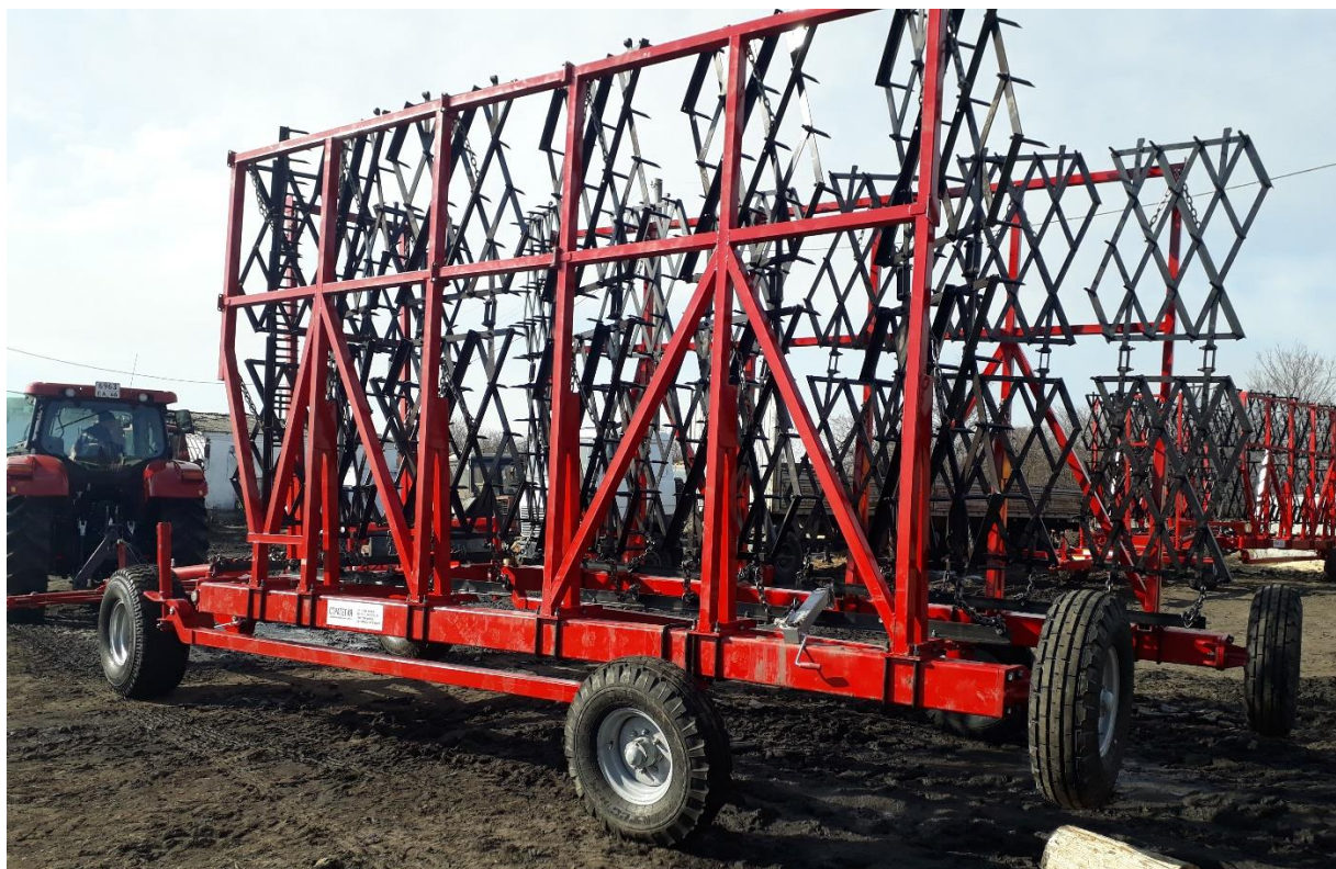
АГС-14-23 четыре единицы, ООО «Агрофирма «Ирбитская», Ирбитский район.