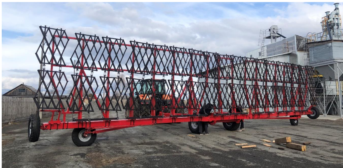
АГС-18-23 две единицы, СПК «Колхоз им. 8 Марта», Талицкий район.

Общество с ограниченной ответственностью «Стратегия 96» 620042, Свердловская область, г. Екатеринбург, ул. Бакинских комиссаров, дом 107, эт. / оф. 1/4 ИНН 6686075417 КПП668601001 р/с 40702810516540026954 УРАЛЬСКИЙ БАНК ПАО СБЕРБАНК г. Екатеринбург к/с 30101810500000000674 БИК 046577674