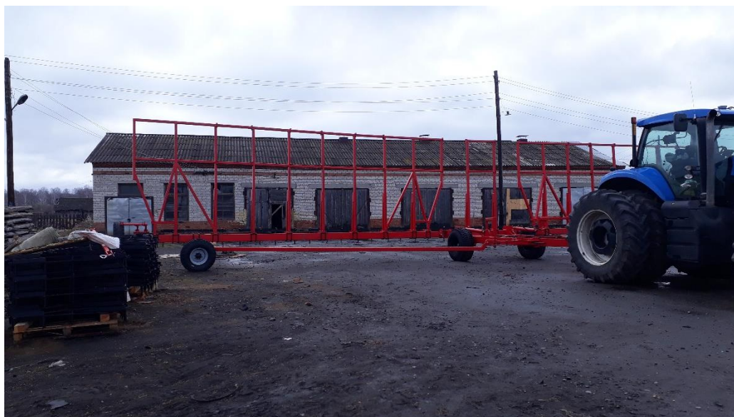
АГС-22-2з, СПК «Заря», Талицкий район. Так же хозяйство приобрело АГС-18-2з.